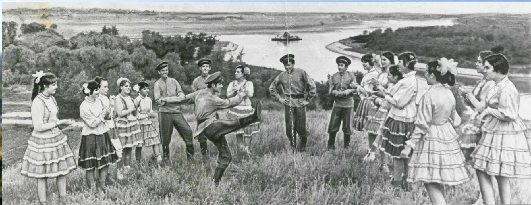
Выступление народного ансамбля танца «Казачок» Усть-Донецкого РДК. 1971 г. ЦДНИРО. Ф.Р-3619. Оп.7. Д.4.

Усть-Донецкий район поэтично называют «сердцем Дона», и связано это не только с географическим расположением. Район является одним из культурных центров Ростовской области и славится своими фестивалями, такими как «Калининское лето», посвященный творчеству писателя Анатолия Калинина, этнографический фестиваль «Донская лоза» - праздник виноградарства и виноделия. Популярны у гостей района и фольклорные праздники - «Широкая масленица», «Праздник донской селедки» и другие.