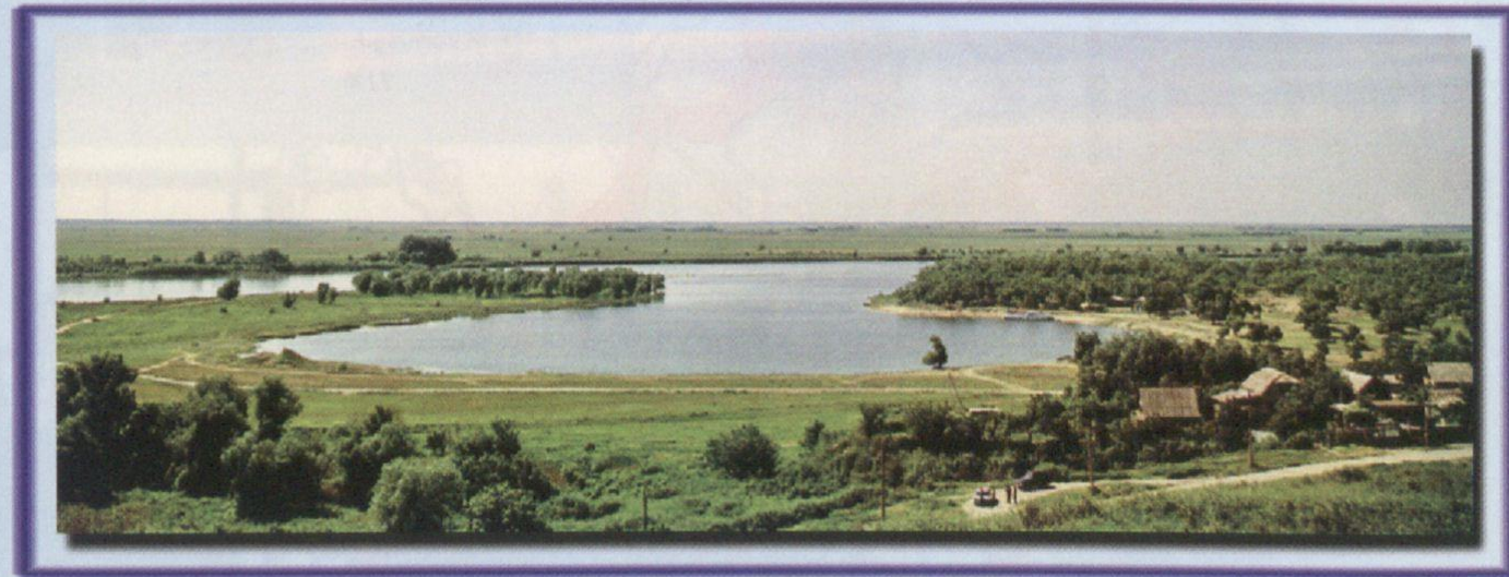
Станица Мелиховская основана предположительно в 1594 г.:

Усть-Донецкий район славится своей богатой историей. На территории района расположены старинные казачьи поселения, такие как станицы Раздорская (впервые упоминается в летописях в 1571 г.), Мелиховская (основана предположительно в 1594 г.), Верхнекундрюченская (1636 г.), Нижнекундрюченская (1643 г.), Усть-Быстринская (1672 г.), хутора Крымский (1775 г.), Пухляковский (1780 г.), Каныгин (1788 г.), Апаринский (1837 г.).