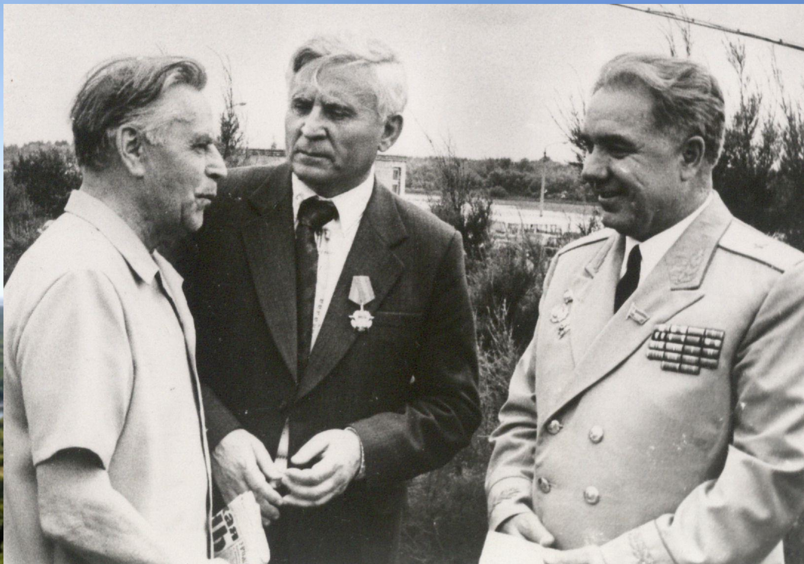
В гостях у А.В. Калинина. 60-летие писателя. 1976 г. ЦДНИРО. Ф.Р-3619. Оп.7. Д.1067.