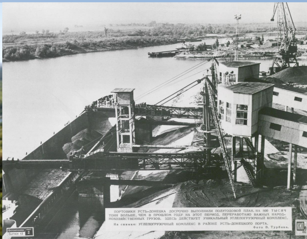
ПОРТОВИКИ УСТЬ-ДОНЕЦКА ДОСРОЧНО ВЫПОЛНИЛИ ПОЛУГODOVOY ПЛАН, НА 800 ТЫСЯЧ ТОНН БОЛЬШЕ, ЧЕМ В ПРОШЛОМ ГОДУ НА ЭТОТ ПЕРИОД, ПЕРЕРАБОТАНО ВАЖНЫХ НАРОДНОХОЗЯЙСТВЕННЫХ ГРУЗОВ, ЗДЕСЬ ДЕЙСТВУЕТ УНИКАЛЬНЫЙ УГЛЕПОГРУЗОЧНЫЙ КОМПЛЕКС. На снимке: УГЛЕПОГРУЗОЧНЫЙ КОМПЛЕКС В РАЙОНЕ УСТЬ-ДОНЕЦКОГО ПОРТА.

Усть-Донецкий район является не только важным культурным, но и промышленным центром Ростовской области. Усть-Донецкий речной порт ведет свою историю с 30 апреля 1960 года и находится в устье реки Северский Донец, имеет припортовую станцию Усть-Донецкая Северокавказской железной дороги. Порт создавался как транспортный узел для отправления больших объемов насыпных, лесных и других грузов с востока на запад страны и в страны Черноморского бассейна.