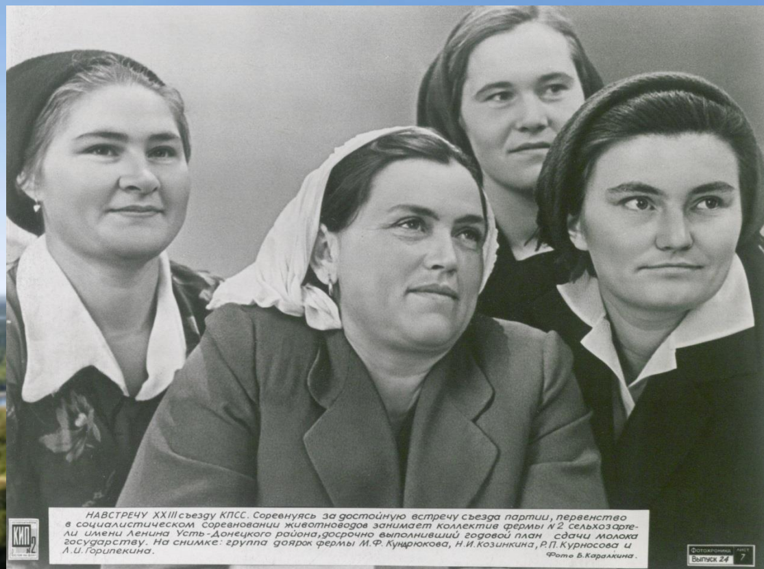
Передовики соревнования животноводов, доярки фермы № 2 сельхозартеля им. Ленина Усть-Донецкого района, 1968 г.