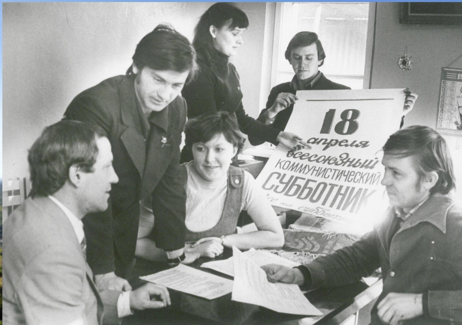
Заседание комиссии по проведению субботника при комитете комсомола порта. 1981 г. ЦДНИРО. Ф.Р-3619. Оп.7. Д.3143.